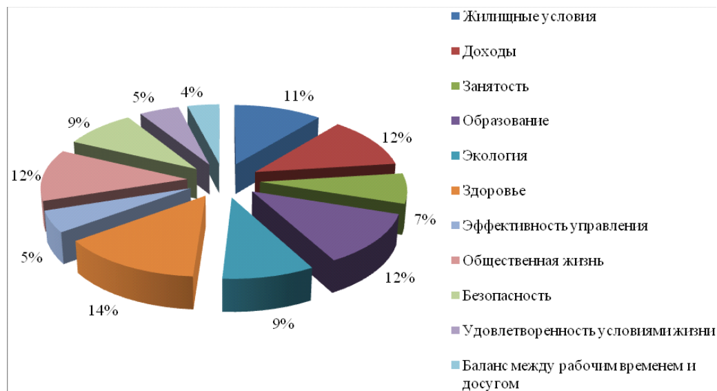
Рис. 2. Диаграмма частоты встречаемости факторов качества жизни в 13 основных методиках, выделяемых [4]

Глобальное изменение климата оказывает влияние не только на здоровье населения и возникновение новых заболеваний, но и на обеспеченность питьевой водой, уровень сельскохозяйственного производства, учащение природных катаклизмов, таких